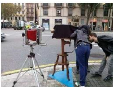
Membres del mNACTEC preparant la recreació

Aquest edifici, un palau neoclàssic és protegit i conegut