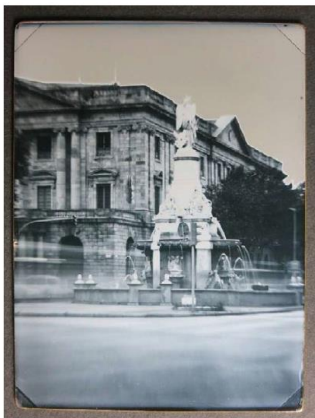
Lloc des del qual s'hauria fet la primera fotografia, el primer balcó del primer pis