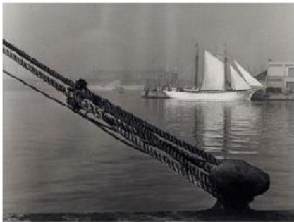
Autor: Rafel Degollada Castany. Positiu actual de negatiu de vidre