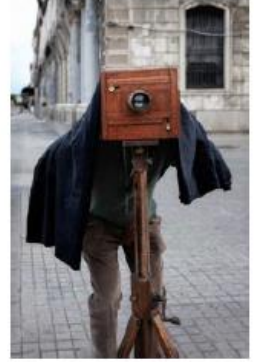
El punt previst per a l'enquadrament