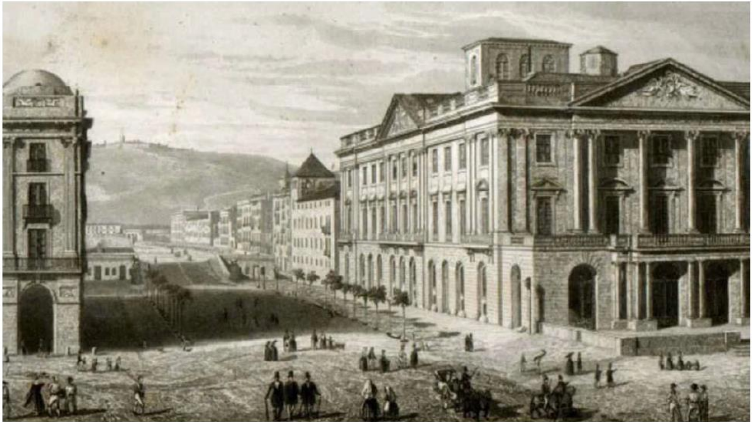
Reproducció del gravat que còpia la imatge del daguerreotip pioner