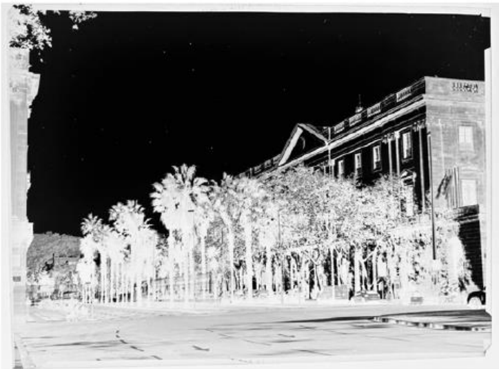
El negatiu (a l'esquerra) i el positiu final de la foto presa