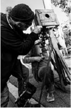
Instal·lant la càmera al cavallet

Butlletí d'Arqueologia Industrial i de Museus de Ciència i Tècnica