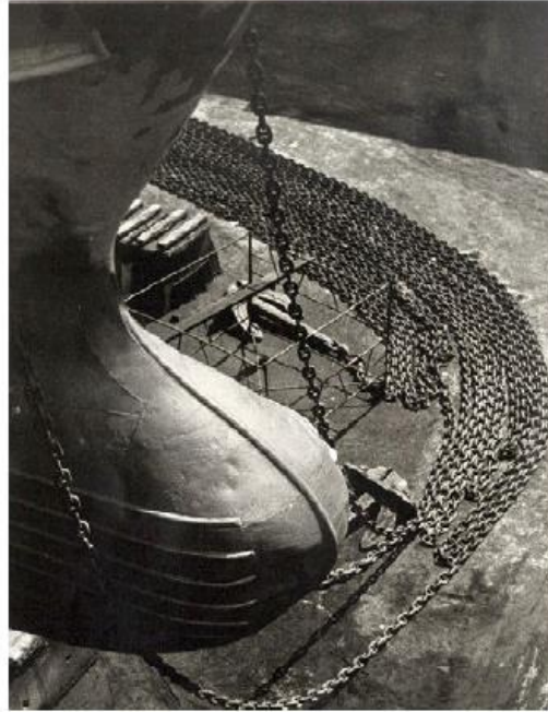
Autor: Josep Closa Miralles. 1988. Gelatinobromur. Sèrie Vulcano. Portada del catàleg de l'exposició de l'Institut d'Estudis Fotogràfics de Catalunya 2006