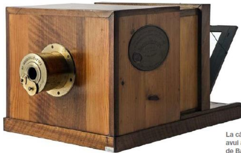
La càmera original, avui a l'Acadèmia de Ciències de Barcelona